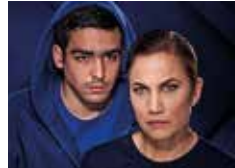
18, 15, 12 y 6 € Precios especiales