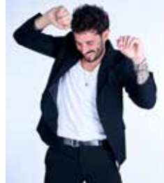
45, 40, 35 y 20 Euros Carné joven: 6 € en paraíso (15% aforo)