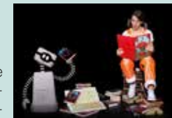
10, 8 y 6 € Precios especiales a partir de 4 años

Una versión libre de la conocida novela de Julio Verne en la que los títeres de diferentes tamaños se entremezclan con personajes y proyecciones. Un espectáculo de humor y poesía visual en el que la fantasía es el motor para llegar a la luna.