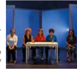
18, 15, 12 y 6 € Precios especiales