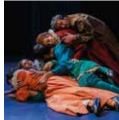
25, 20, 15 y 6 € Precios especiales