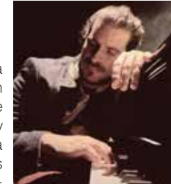
12, 10, 8 y 6 €